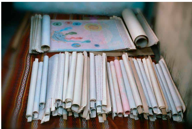
Прокрутка. Книга и Ягненок (Апокалипсис 5).

я просил выявить, каждого из которых в своем законодательстве просил Отец.