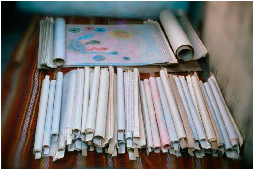
Сувої і Агнець (Апокаліпсис 5)

https://www.alfayomega.com/uk/ і прочитайте, ЩО ГРЯДЕ, НЕБЕСНУ НАУКУ І БОЖЕСТВЕННЕ ПОХОДЖЕННЯ СРІБНИХ РЕЧЕЙ.