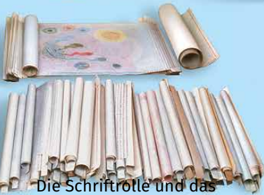
Die Schriftrolle und das Lamm (Apokalypse 5)

Bitte besuchen Sie https://www.alfayomega.com/de/ und lesen Sie was ist zu kommen und Himmlischen Wissenschaft zu.