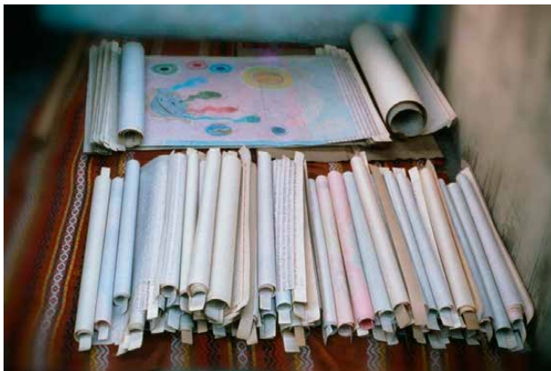
Прокрутка. Книга и Ягненок (Апокалипсис 5).

АЛЬФА И ОМЕГА: Да, я собираюсь сказать вам это, все мыслимые вещи просят у Бога, так же, как и любые другие просьбы изобрести, я просил выявить, каждого из которых в своем законодательстве просил Отец.