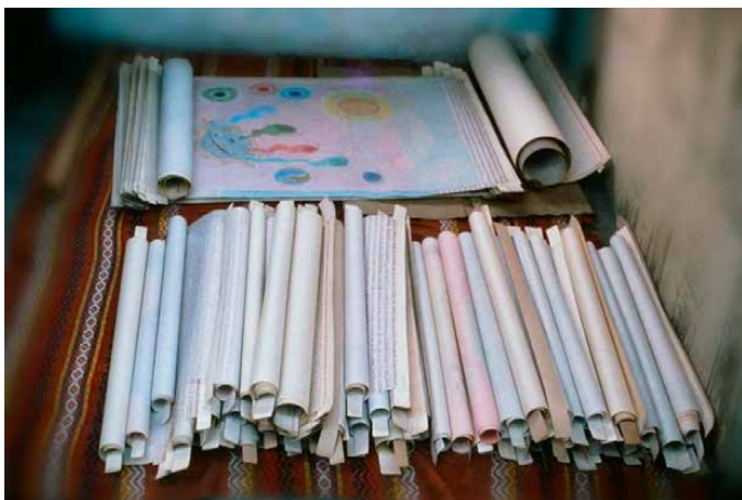
MATERIALIZZAZIONE DELL'APOCALISSE, CAPITOLO 5

pane col sudore della tua fronte; perché ciò che è in alto è uguale a ciò che è in basso; nessuno è nato perfetto; tutti sono nati innocenti e carenti, di qualsiasi scienza; tutto costa nell'Universo; tutto è lotta; la divina parabola che lo spiega, si riferisce a tutte le creature dell'Universo; nemmeno le navi di argento smettono di compiere il divino mandato; e significa che è necessario lottare nell'imperfezione per raggiungere la perfezione.